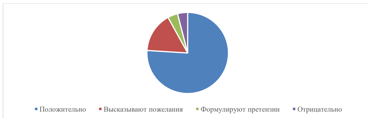
Диаграмма 2. Степень удовлетворенности родителей (законных представителей) обучающихся качеством предоставления образовательных услуг и выявления проблем

Из диаграммы видно, что большая часть родителей удовлетворены качеством предоставления образовательных услуг. Высказаны пожелания о введении универсального профиля обучения.